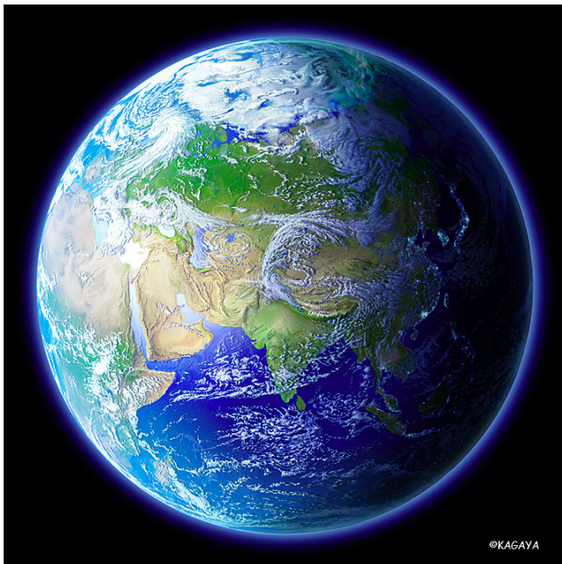
Afb: Blue earth www.Kagayastudio.com ©

Het ziet er naar uit dat 2010 een jaar met veel vernieuwing en bewustzijns groei zal zijn. Oude patronen voldoen niet meer en zullen worden uitgedaagd en ingehaald door vernieuwingen. Vooral vernieuwingen in ons bewustzijn, op technologisch vlak en in onze energievoorziening. Het is tijd om het mes in het oude te zetten en ruimte te maken voor vernieuwing. Daarnaast mogen we in 2010 leren hoe het is om te Leven in eenheid en vrijheid. Het spirituele proces hierachter wordt belicht evenals de ontwikkeling naar het Eenheidsbewustzijn in het Watermantijdperk. Vanuit overleving zal veel wilskracht en ego ingezet worden om nog iets tot stand te brengen; overgave aan de Goddelijke Wil is het uiteindelijke doel. Ten slotte zal in 2010 het oude en nieuwe geïntegreerd moeten worden. Lees meer hierover in dit artikel.